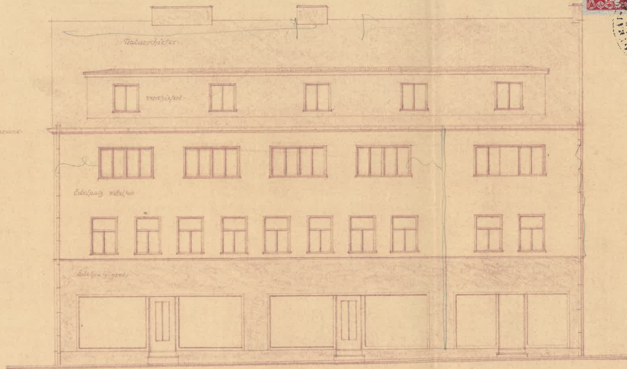
— Fassade Wallensteinstrasse —